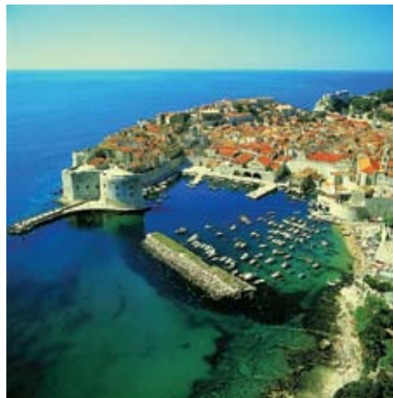
Πανοραμική άποψη του Ντουμπρόβνικ.

Πρωινό στο ξενοδοχείο και στην συνέχεια θα αναχωρήσουμε για τα Τίρανα. Άφιξη στα Τίρανα, ξενάγηση της πόλεως μεταφορά στο ξενοδοχείο, τακτοποίηση, δείπνο και διανυκτέρευση.