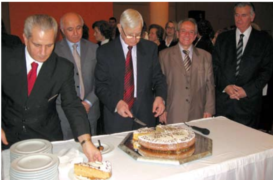
Η πίττα κόπηκε (πάνω). Μένει μόνο να μοιραστούν τα κομμάτια και να ακολουθήσει το γλέντι (κάτω).

Εμείς κρούομεν των κώδωνα του κινδύνου και ελπίζουμε σε ότα ακουόντων.