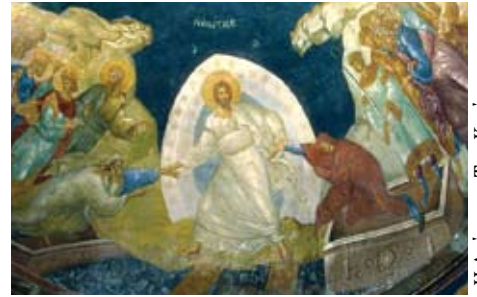
Η Ανάσταση Του Κυρίου

σε όλα τα μέλη και τους φίλους του Συνδέσμου μας χαρούμενο και ευλογημένο Πάσχα. Η ευλογία του Παναγίου Τάφου πάντοτε να τους συνοδεύει.