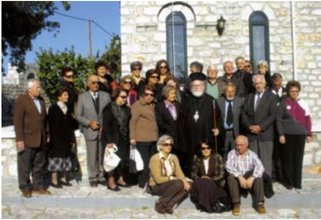
Μέλη του Συνδέσμου μας στο στο Μοναστήρι Πλατυτέρας των Ουρανών και Αγίου Δημοσθένους.