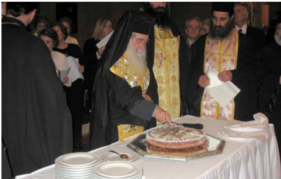
Ο Αρχιεπίσκοπος Θαβωρείου κ.κ. Μεθόδιος ευλογεί την πίττα του Συνδέσμου, πριν αυτή κοπεί και για το 2010.