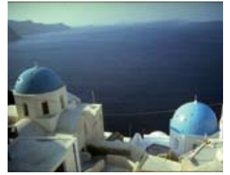
Εκκλήσια στα Σαντορίνη.

...εύχεται ολόψυχα, σε όλα τα μέλη και τους φίλους του Συνδέσμου ευχάριστες καλοκαιρινές διακοπές.