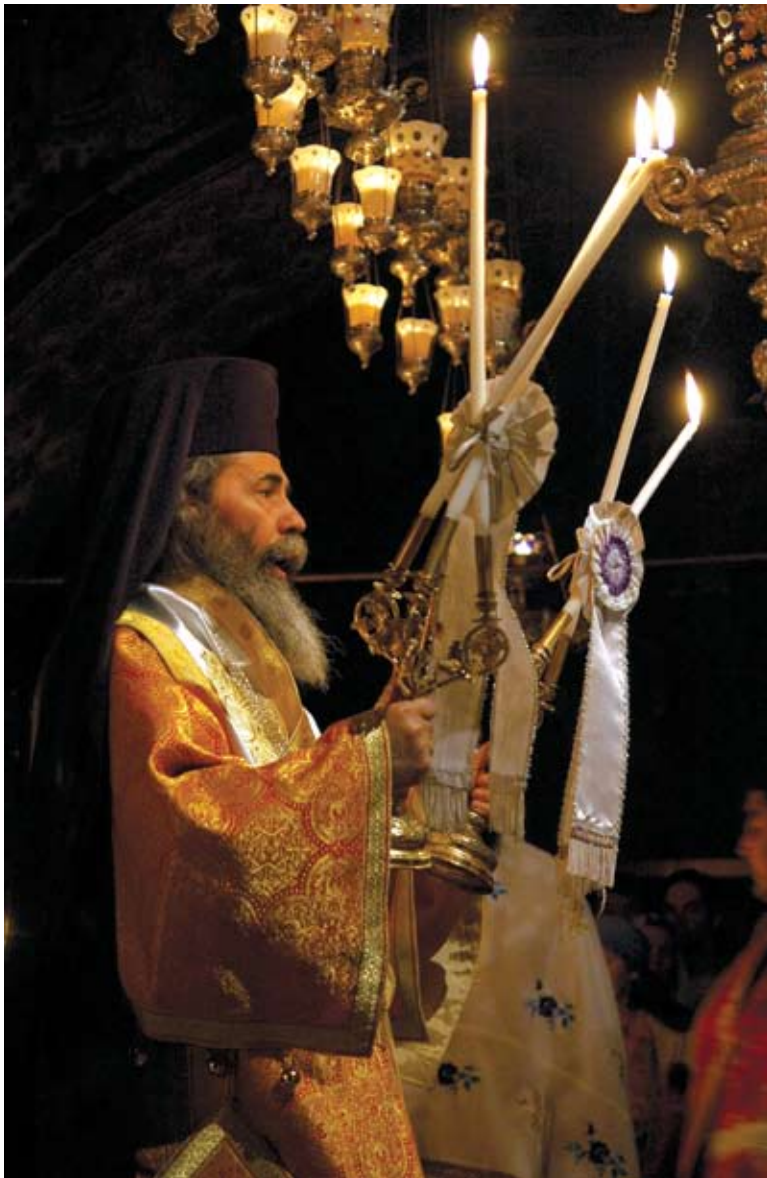
Πατριάρχης Ιεροσολύμων Θεόφιλος Γ΄

Ούτος την προσληφθείσαν ανθρωπίνην φύσιν ημών έφερε μεθ' Εαυτού εις τον Σταυρόν και εις τον Άδην και ανέστησε και εις τον ουρανόν ανεβίβασε και εκ δεξιών του Ανάρχου Πατρός Αυτού εις το διηνεκές εκάθισεν.