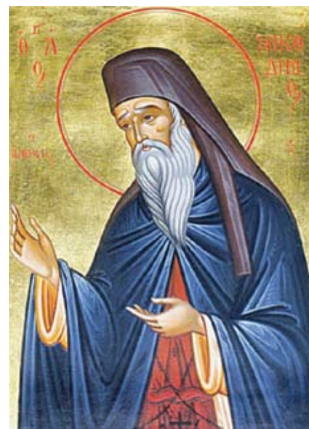
Ο Άγιος Νικόδημος.