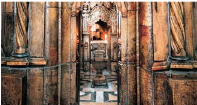
ΘΕΟΦΙΛΟΣ ο Γ΄

Ε λέω Θεού Πατριάρχης της Αγίας Πόλεως Ιερουσαλήμ και πάσης Παλαιστίνης παντί τω πληρώματι της Εκκλησίας, χάριν και έλεος και ειρήνην από του Παναγίου και Ζωοδόχου Τάφου του Αναστάντος Χριστού.