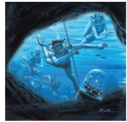
Πινακας του Mort Kunstler

Όμως πιθανότερη είναι η ανακάλυψη στοιχεία που θα αφορούν κυρίως τις κλιματικές αλλαγές που συντελέστηκαν τα τελευταία 500.000 χρόνια, όπως πιστεύει ο Ούλριχ Χαρμς, επικεφαλής του κλιμακίου και γεωλογικού τομέα της αποστολής. Εμπνευστές της έρευνας είναι δύο Ισραηλινοί επιστήμονες, οι οποίοι προσπαθούσαν εδώ και χρόνια να πείσουν το Διηπειρωτικό Πρόγραμμα Γεωτρήσεων- με έδρα τη Γερμανία- να επιχειρήσει στον πυθμένα της Νεκράς Θάλασσας, όπου δεν έχει ξαναγίνει γεώτρηση. Λόγω της αστάθειας στην περιοχή, εξαιτίας των συγκρούσεων ανάμεσα σε Παλαιστίνιους και Ισραηλινούς, καθυστερούσε όλα αυτά τα χρόνια η επιστημονική έρευνα, αλλά φέτος πήρε το "πράσινο φως". Σε αυτό βοήθησε και η συμμετοχή Παλαιστίνιων και Ιορδανών ερευνητών,