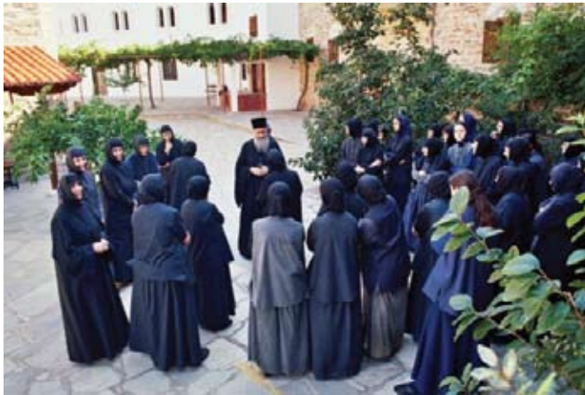
Μεταμόρφωση Χαλκιδικής. Η Γερά Μονή Σουρωτής.

Καλλιθέα και θα φθάσουμε στην ΧΑΝΙΩΤΗ Στάση. Συνεχίζοντας το γύρο θα δούμε το πευκοχώρι, τα λουτρά και θα καταλήξουμε στην ΣΚΑΛΑ ΦΟΥΡΚΑΣ όπου θα γευματίσουμε. Κατά το απόγευμα θα αναχωρήσουμε για ΞΑΝΘΗ.