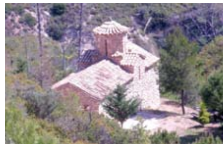
ΙΕΡΟΣ ΝΑΟΣ ΟΣΙΟΜΑΡΤΥΡΟΣ ΝΙΚΟΛΑΟΥ ΒΟΥΝΕΝΟΙΣ ΠΡΟΥΛΑΙΤΣΑΣ ΚΙΑΤΟΥ ΚΟΡΙΝΘΙΑΣ

Ακράτα – ανάβαση στο Χελμό, μέσα από μια καταπράσινη διαδρομή, που φιλοξενεί τη γραφική Λίμνη Τσιβλού, στάση. Η Ζαρούχλα είναι ορεινό χωριό γεμάτο πλατάνια, καστανιές και έλατα μας φιλοξενεί στην συνέχεια για περιπάτους & γεύμα προαιρετικά. Μετά το μεσημέρι αναχώρηση για Αθήνα.