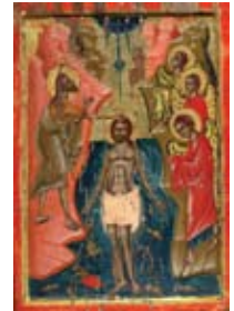
Η Βάπτιση του Χριστού. Εορτάζεται στις 6 Ιανουαρίου.

Σε όλα τα μέλη και τους φίλους του Συνδέσμου για τις άγιες ημέρες των Χριστουγέννων και του Νέου έτους 2012, υγεία, χαρά, ευτυχία και η ευλογία του Παναγίου Τάφου πάντοτε να τους συνοδεύει.