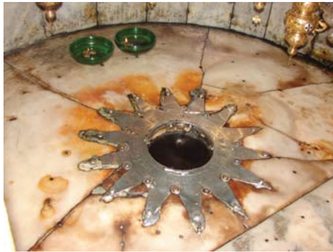
Βηθλεέμ. Εδώ γεννήθηκε ο Ιησούς.

>> δεχθεί ο Πατριάρχης Ιεροσολύμων. Επιστροφή στο ξενοδοχείο. Απόγευμα ελεύθερο. Δείπνο και διανυκτέρευση.