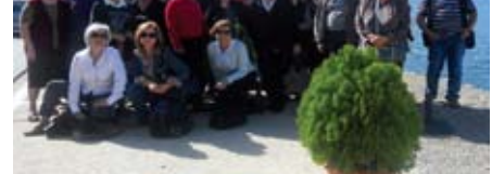
Από την εκδρομή των Τζουμέρκων.

Ευχαριστούμε πολύ γι' αυτό τους διοργανωτές αυτής της εκδρομής και ιδιαίτερα τον Κο Σταυρόπουλο τον Κο Μάρκου και τον Κο Κολυβά και οπωσδήποτε τον έμπειρο οδηγό μας