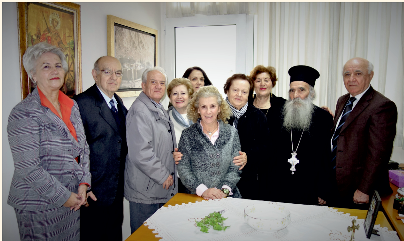
Μέλη Δ.Σ. και φίλοι του Συνδέσμου κατά τη διάρκεια του αγιασμού.

Ο καθιερωμένος αγιασμός του Συνδέσμου για την έναρξη των εργασιών του έτους είχε άρωμα Φρέατος του Ιακώβ. Παρέστη και ευλόγησε τον αγιασμό ο Πανοσιολογιώτατος Αρχ/της Ι.Μ. Φρέατος του Ιακώβ π. Ιουστίνος μαζί με τον Πανοσιολογιώτατο Αρχ/τη π. Χρύσανθο Τσαβολάκη, εφημέριο της Αγίας Δύναμης. Παρευρέθησαν άνω των 70 ατόμων παλαιά, νέα μέλη και φίλοι, αντάλλαξαν απόψεις, απόλαυσαν τη σεμνή και όμορφη τελετή και δέχθηκαν με ευχαρίστηση τα κεράσματα που προσέφερε ο Σύνδεσμος.