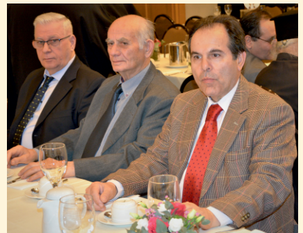
Αγαπητά μέλη του Συνδέσμου.