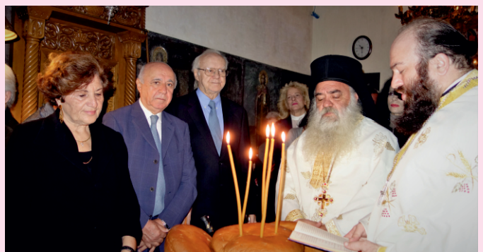
Τέλεση Θ. Λειτουργίας του Συνδέσμου στην εν λόγω εκκλησία.