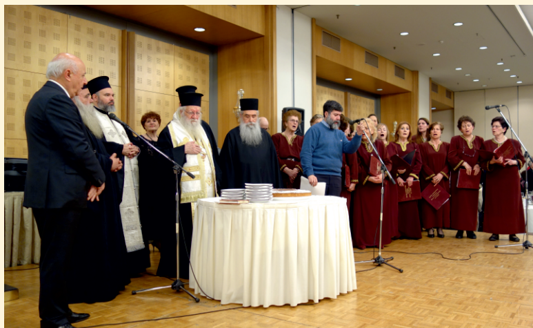
Το Δ.Σ., οι Ιερείς και η Χορωδία Γυναικών Αγίας Παρασκευής.

Όπως κάθε χρόνο έτσι και φέτος στις 10 Φεβρουαρίου 2019 πραγματοποιήθηκε η κοπή της Βασιλόπιτας του Συνδέσμου στο Ξενοδοχείο «DIVANI CARAVEL».