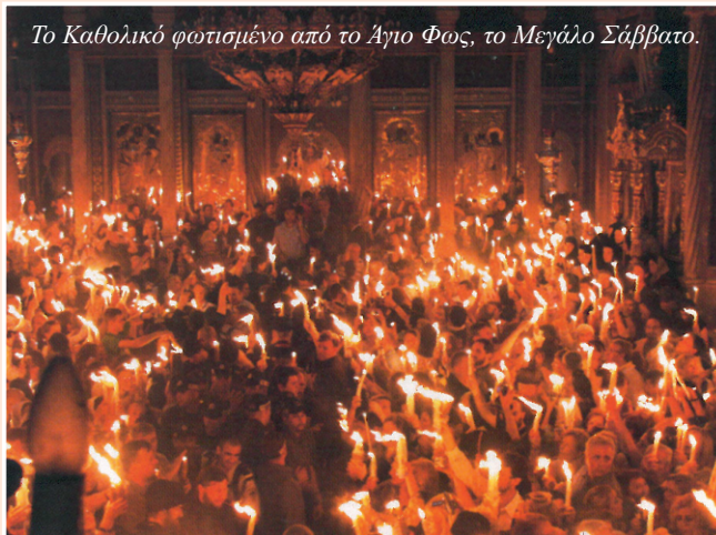
Το Καθολικό φωτισμένο από το Άγιο Φως, το Μεγάλο Σάββατο.

Όταν βγαίνει το Άγιο Φως δεν ανάβουν μόνο τα κεριά που κρατάει ο Πατριάρχης, διότι τότε όλοι οι άνθρωποι θα είχαν αμφιβολίες ότι κάτι συμβαίνει. Όταν εξέρχεται το Άγιο Φως από τον Τάφο του Χριστού, βγαίνει έξω εν είδει ουράνιου τόξου με πολλά χρώματα που ξεχύνεται σαν φωτεινός χείμαρρος ή σαν χιλιάδες πυγολαμπίδες μέσα σε ολόκληρο το Ναό που είναι τεράστιος και έχει μεγάλη διάρκεια. Πηγαίνει πάνω στο Γολγοθά, ανάβουν τα κεριά πιστών που τα κρατάνε ψηλά, ανάβουν καντήλια, επίσης ανεβαίνει στον Ιερό Ναό των Αγίων Κων/νου και Ελένης που είναι 10 μέτρα ψηλότερα, κολλητά στη Μεγάλη Ροτόντα και τα βόρεια παράθυρα βλέπουν μέσα το Ναό της Αναστάσεως. Βγαίνει στο προαύλιο του Ναού της Αναστάσεως και το προαύλιο του Ναού των Αγίων Κων/νου και Ελένης. Όμως το κυριότερο είναι ότι όταν ο Πατριάρχης εισέρχεται στο Άγιο Κουβούκλιο που είναι ο Τάφος του Χριστού για να πάρει το Άγιο Φως, πίσω του ακολουθεί ο Ηγούμενος των Αρμενίων, γιατί είναι δικαίωμα που έχουν, ο οποίος παρακολουθεί τα πάντα. Αν συνέβαινε κάτι πονηρό θα έπρεπε να ανοίξει η γη να μας καταπιεί, διότι καιροφυλαχτούν χρόνια τώρα για να βρουν κάτι παράνομο να μας συκοφαντήσουν και να μας κάνουν πόλεμο.