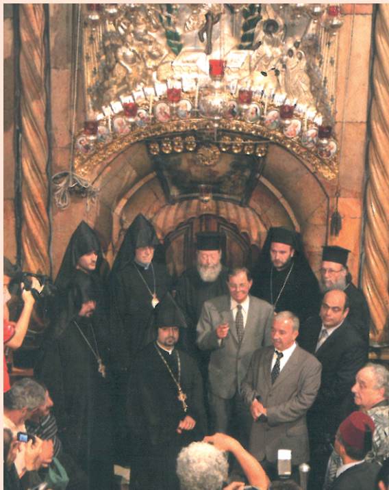
Το σφράγισμα του Ιερού Κουβουκλίου του Παναγίου Τάφου, πριν την τελετή της αφής του Αγίου Φωτός, το Μ. Σάββατο.

Μόλις ο Πατριάρχης βγει από το Ιερό Κουβούκλιο κρατώντας δύο αναμμένους πυρσούς κατευθύνεται στο Άγιο Βήμα του Καθολικού, ενώ οι χοροί ψάλλουν το « Ανάστα ο Θεός κρίνων την Γην » και αρχίζει η καθιερωμένη Θεία Λειτουργία του Μεγάλου Βασιλείου, ενώ οι Αρμένιοι εισέρχονται στον Πανάγιο Τάφο και πλένουν το μάρμαρο του Αγίου Τάφου με ροδοστάγμα. Η όλη τελετή είναι λαμπρή, η δε ευλογία του Αγίου Φωτός μεταδίδεται πλέον σε πολλά σημεία της Ορθόδοξης Χριστιανοσύνης, καθώς μεταφέρεται με ειδικές πτήσεις, ώστε να διανεμηθεί το βράδυ του Μεγάλου Σαββάτου στους κατά τόπους ορθοδόξους ναούς κατά την τελετή της Αναστάσεως.