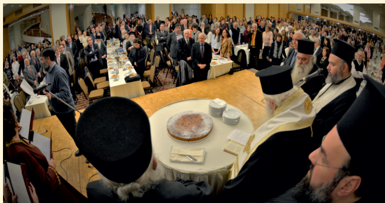
Αποψη της αίθουσας πριν την κοπή της Βασιλόπιτας.