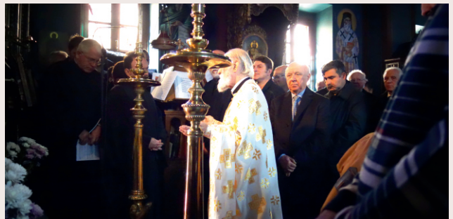
Εκκλησιασμός στον Ι.Ν. Αγίων Αναργύρων στην Εξαρχία του Παναγίου Τάφου στην Πλάκα