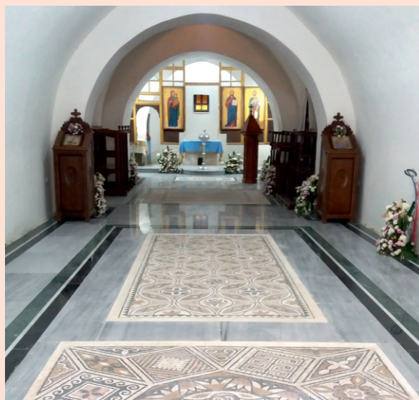
Ι.Μ. Τιμίου Προδρόμου στον Ιορδάνη υπό γενική αναμόρφωση.