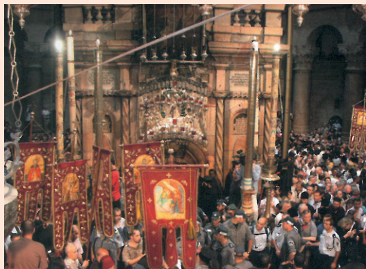
Η λιτανεία γύρω από το Ιερό Κουβούκλιο του Παναγίου Τάφου, πριν την τελετή της αφής του Αγίου Φωτός, το Μ. Σάββατο.