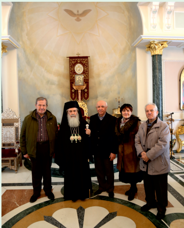
Τα μέλη του Δ.Σ. με την Α.Θ.Μ. τον Πατριάρχη Ιεροσολύμων κ. Θεόφιλο τον Γ' στην Αίθουσα του Θρόνου.

Μεγαλόπρεπη ήταν η Θεία Λειτουργία την Κυριακή της Σταυροπροσκυνήσεως στον Ναό της Αναστάσεως με την παρουσία του Πατριάρχη Ιεροσολύμων κ.κ. Θεόφιλου, και πλήθους ιερωμένων υπό την καθοδήγηση του τελετάρχη του Πατριαρχείου πατρός Βαρθολομαίου. Και μετά το τέλος η υποδοχή του εκκλησιάσματος από τον Πατριάρχη στην Αίθουσα του Θρόνου, το κέρασμα, οι ομιλίες, ο χαιρετισμός και η αναμνηστική φωτογραφία.