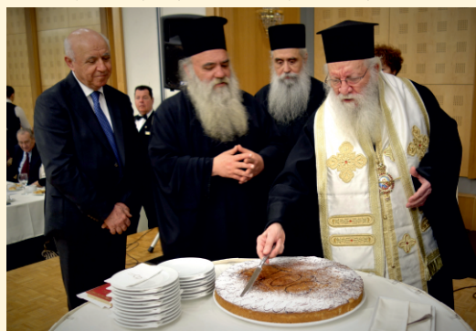
Ο Σεβ/τος Μητρ/της Βελεστίνου κ. Δαμασκηνός ευλογεί την Βασιλόπιτα.