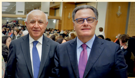
Ο βουλευτής, πρώην Υπουργός Αμύνης και Επίτιμο Μέλος του Συνδέσμου κ. Π. Παναγιωτόπουλος με τον Πρόεδρο.