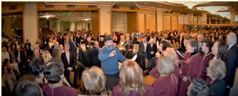
Άποψη της αιθούσης κατά τη διάρκεια της εκδήλωσης.