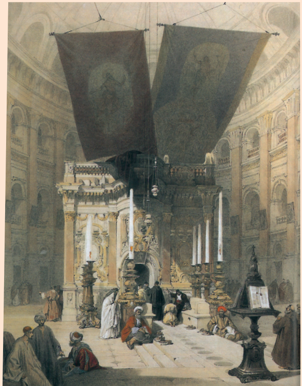
Το Ιερό Κουβούκλιο του Παναγίου Τάφου το 1839 σε λιθογραφία του David Roberts.

(Ηγούμενος της Ι.Μ. Αγίων Θεοδώρων και Τυπικάρης του Πατριαρχικού Μοναστηριακού Ναού των Αγίων Κων/νου & Ελένης)