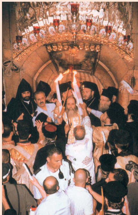
Η Α.Θ.Μ. ο Πατριάρχης κ. Θεόφιλος Γ' κατά την τελετή της αφής του Αγίου Φωτός.

Από τους πυρσούς αυτούς, ο Πατριάρχης μεταδίδει το Άγιο Φως στους πιστούς έξω από τον Πανάγιο Τάφο, οι οποίοι πανηγυρίζουν με εκδηλώσεις χαράς και ευφροσύνης για την ευλογία της ελευσεως και πάλι του Αγίου Φωτός. Πριν την μετάδοση στους πιστούς, ο Πατριάρχης μέσω δύο ειδικών οπών στα τοιχώματα του πρώτου θαλάμου του Κουβουκλίου μεταδίδει το Άγιο Φως σε εκπρόσωπο μιας οικογένειας Ορθοδόξων που το μεταφέρει στο Άγιο Βήμα του Καθολικού και το παραδίδει στον Σκευοφύλακα από τη δεξιά οπή και στους εκπροσώπους των Αρμενίων, των Κοπτών και των Σύρων από την αριστερή οπή. Στην τελετή αυτή συγκεντρώνεται μέγα πλήθος πιστών, τόσο προσκυνητών όσο και αραβοφώνων Ορθοδόξων, με αποτέλεσμα και η πρόσβαση στο Ναό να είναι αδύνατη αλλά και συνωστισμός να παρατηρείται.