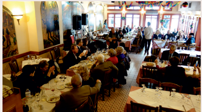
Εικόνες από το κέντρο «Γέρος του Μωριά»