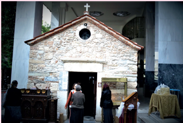
Το εξωτερικό της εκκλησίας.

Το ιστορικό αυτό εκκλησάκι, η Αγία Δύναμη, βρίσκεται στο κέντρο της Αθήνας και συγκεκριμένα στη συμβολή των οδών Μητροπόλεως 15-17 και Πεντέλης 2, εκεί που ήταν παλιά το υπουργείο Παιδείας. Σύμφωνα, μάλιστα, με τον Νικηφόρο Κάλλιστο, εκκλησία με το όνομα «Αγία Δύναμις» υπήρχε και στην Κωνσταντινούπολη.