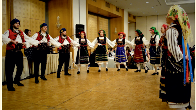
Χορευτικά Λυκείου Ελληνίδων Παπάγου-Χολαργού & Κέντρου Λαϊκού Πολιτισμού Αιγάλεω.

Εκείνη με τη σειρά της αναφερόμενη εν συντομία στις πρόσφατες εργασίες συντήρησης του Ιερού Κουβουκλίου από έγκριτη διεπιστημονική ομάδα του Ε.Μ.Π. εξήρε την κεφαλαιώδους σημασίας επιταγή διατήρησης του ελληνορθόδοξου χαρακτήρα των Παναγίων Προσκυνημάτων, η οποία αποτελεί τη στοχοθεσία της εξηκονταετούς δράσης του Συνδέσμου μας.